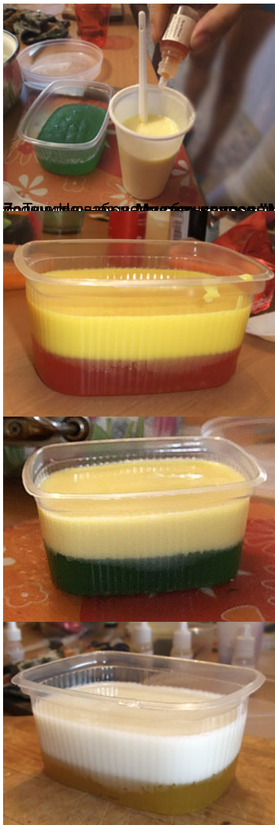
Мастер-класс "Мыловарение дома" и формулы