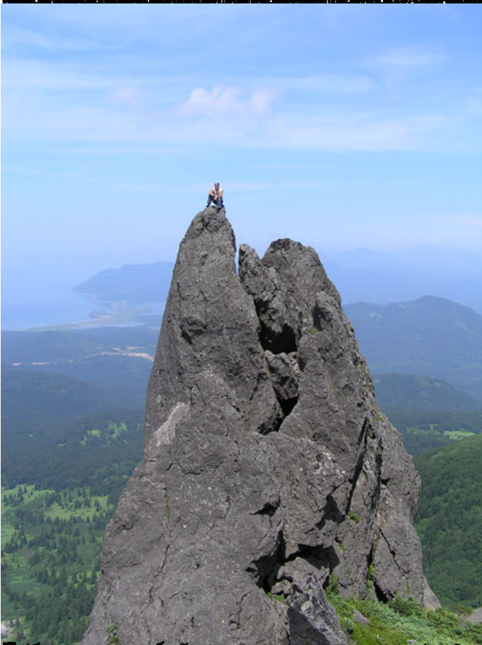
Вид на вулкан Менделеева с вершины. Вулкан Менделеева, Камчатка. Вид на вулкан Менделеева с вершины