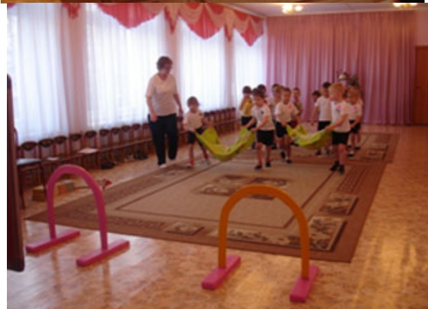
Методические занятия (в форме подвижных игр) направлены на формирование у детей навыков здорового образа жизни, здоровья детей после