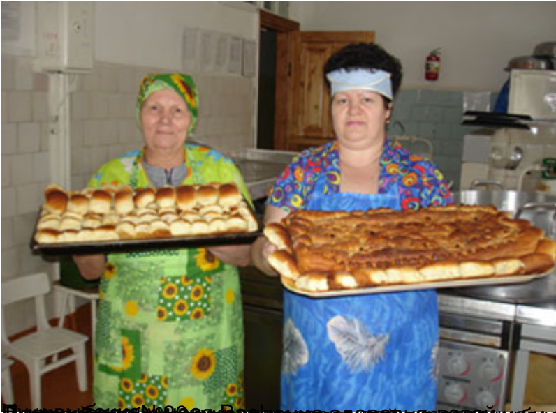
Реализация программы «Здоровье» направлена на формирование у детей привычки здорового образа жизни, здоровья детей: