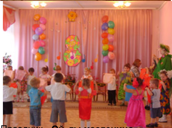
Праздник «Ой, ты масленица»