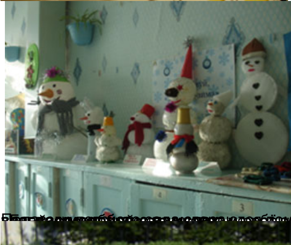
Благодаря своим стараниям ребята смогли увидеть прекрасное, верить в человека