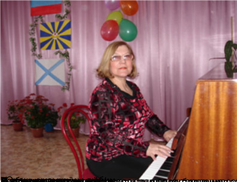
добавлены в будни утренняя гимнастика,