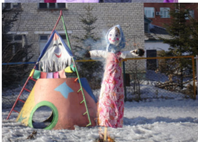
Воспитатель рассказывает детям о русских народных обычаях.